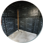
Impermeabilização de reservatórios