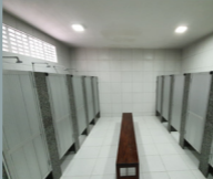
Divisórias de granito e portas de alumínio.