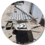
Revestimento de calçada